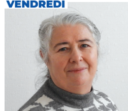
Mme MORTUAIRE Adjointe chargée de la Jeunesse

Sur rendez-vous 03 27 86 93 02 - secretariat@ville-somain.fr